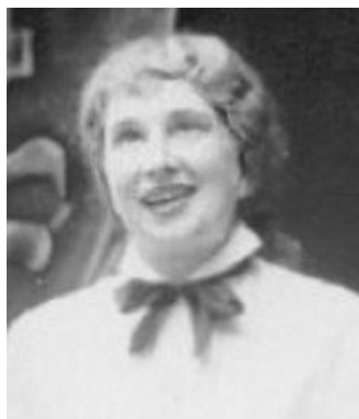
Jako ochotnická herečka.

S opožděním se Svojsíkův oddíl dozvěděl,