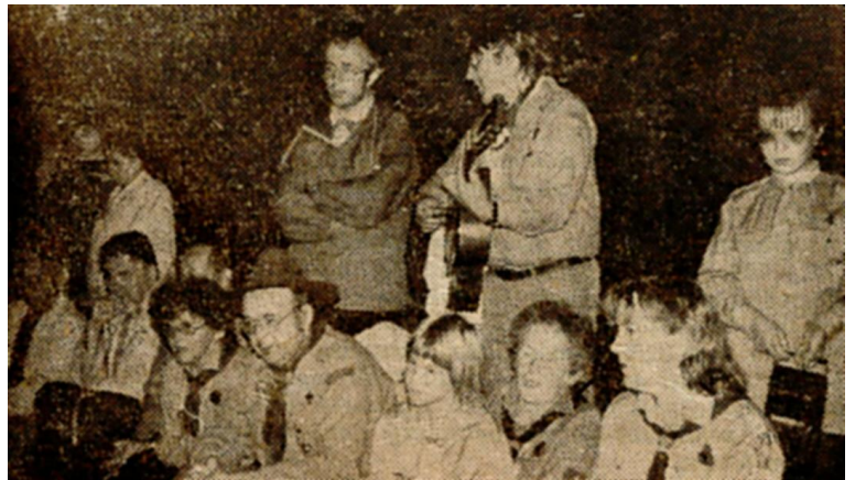
Zde je zachycena jako třetí sedící zleva.