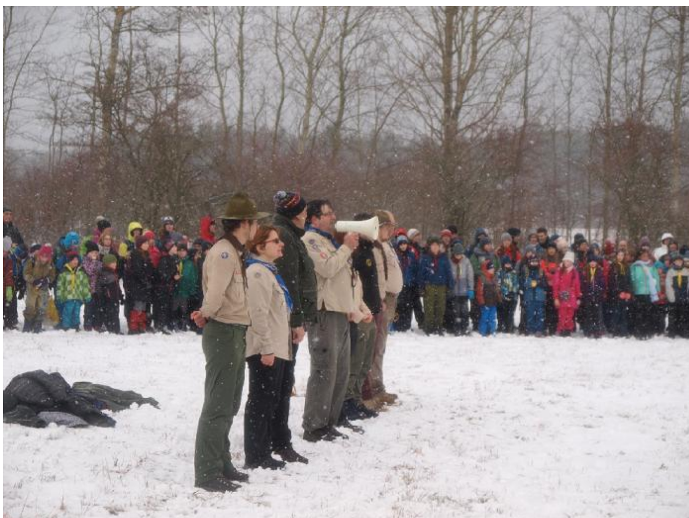
Celkově organizátoři odhadli účast na asi 1500 osob všech věkových kategorií.