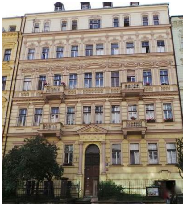
Foto domu, kde se v přízemí nachází zmíněná klubovna.

V rámci doprovodného programu kurzu, který hostila klubovna Okresní rady Junáka Praha 2, si účastníci prohlédli blízké okolí, v němž se mj. natáčely sekvence filmu o Rychlých šípech „Záhada hlavolamu“. Klubovna ORJ Praha 2 se nachází v Bělehradské ulici a bývá nejen místem pravidelných setkání rady, ale i kurzů a všem, kdo dodržují stanovená pravidla, poskytuje také i jinak „střechu nad hlavou“.