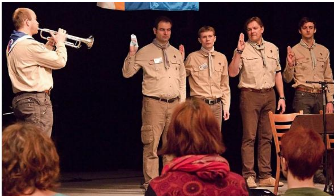
... zahájení ...