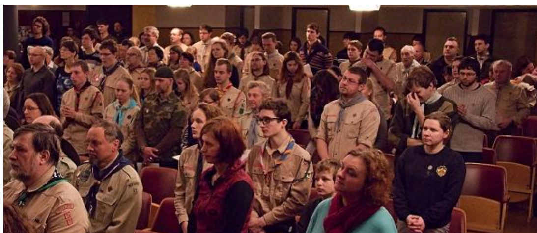
... průběh ...