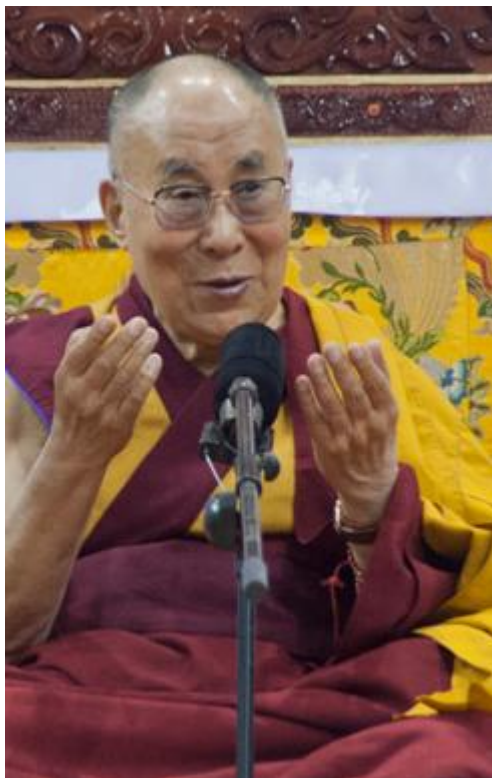
Tenzin Gyatso, čtrnáctý Dalai Lama Tibetu