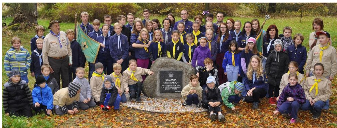
Fotografie ze slavnostního odhalení pamětní desky u Stromu republiky v Mimoni.