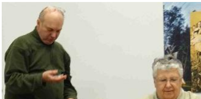
Sestra Amálka připomněla únorovou schůzku (v úterý 12. února 2019 v klubovně Na Celnici),