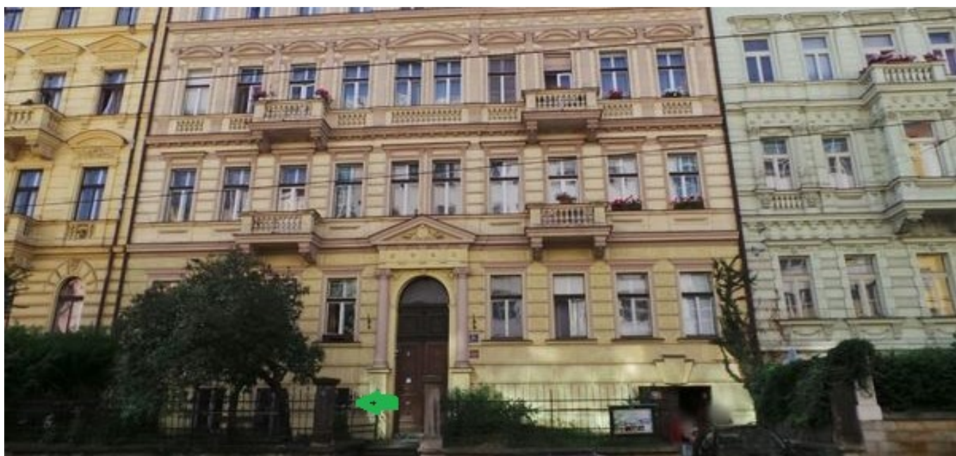
<-- Klubovna ORJ Praha 2