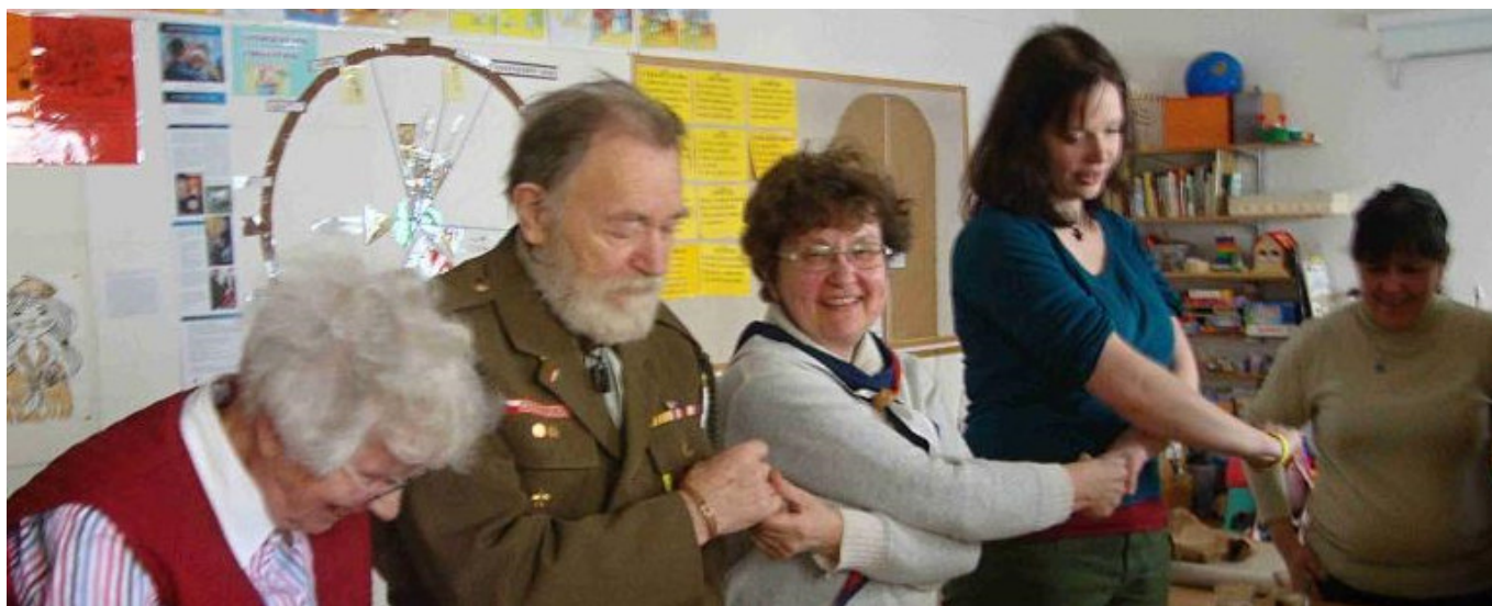
... a kruh na rozloučenou.