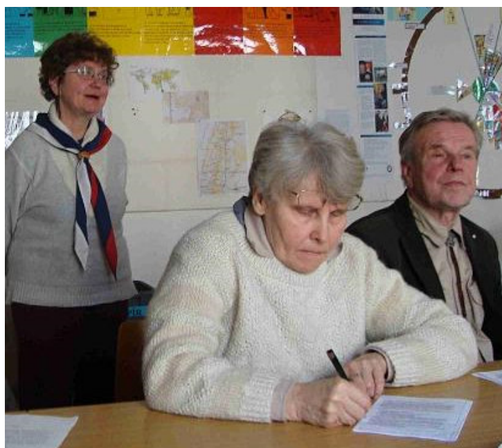
Podepisování přání nepřítomným sestrám a bratrům ...